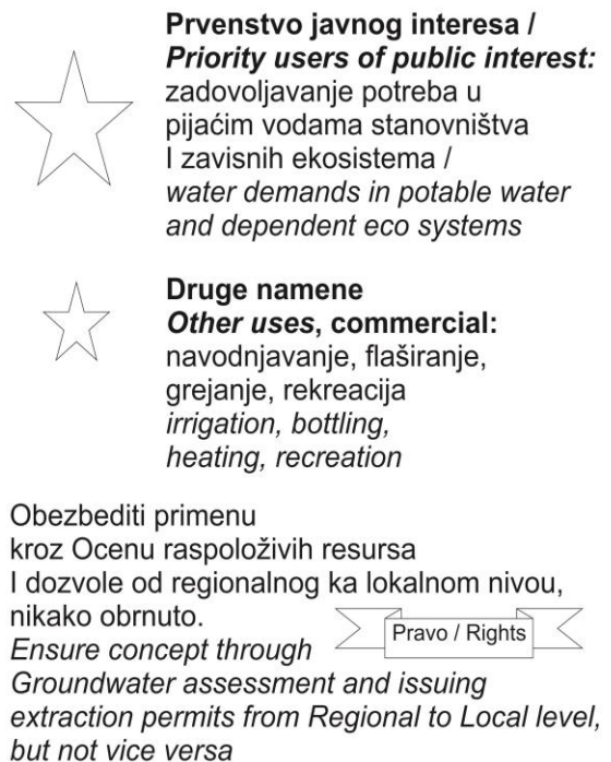
Слика 3 Приоритетни па онда други потрошачи – механизам обезбеђења Figure 3 Priority and then after other consumers – Assurance mechanism

Da li se možemo vratiti na taj put? Verovatno je moguće uz značajne napore i reviziju svih izdatih odobrenja, saradnju vodoprivrednih, i organa nadležnih za poslove geologije, i pre svega završetak započetih studija i analiza u prekinutim strateškim hidrogeološkim projektima.